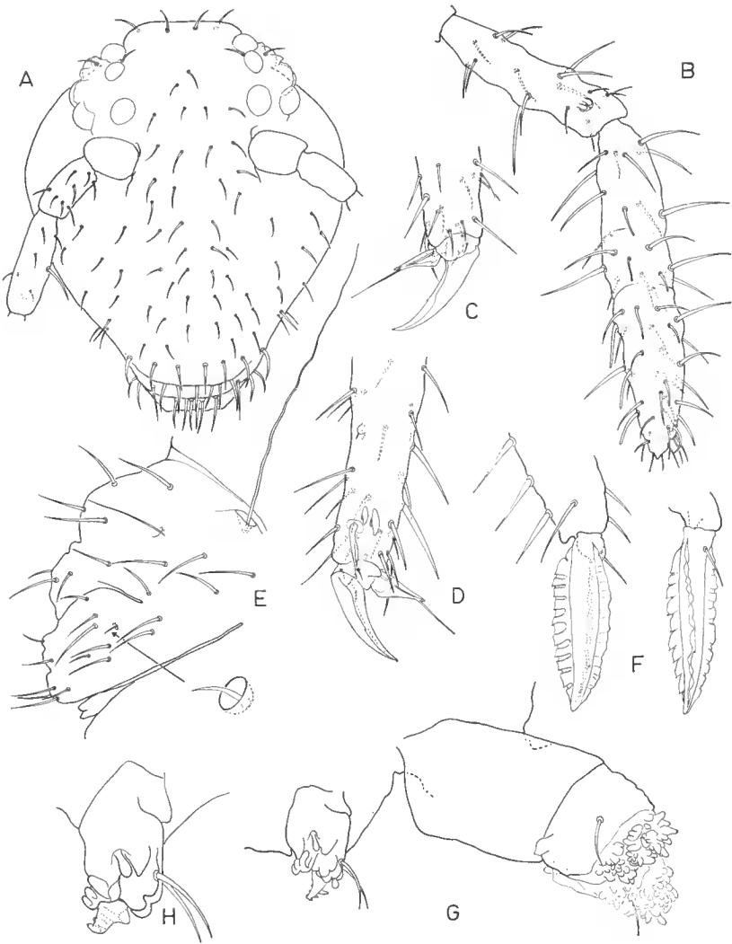
FIG. 2. — Sminthurides monnioti n. sp. ♀.

A, chétotaxie céphalique. — B, Ant. III et IV en vue postérieure. — C, griffe de P1. — D, griffe de P3. — E, petit abdominal en vue de profil. — F, le mucron, en vue postérieure, à gauche et en vue de profil externe, à droite. — G, tube ventral et rétinaclé en vue de profil. — H, rétinaclé.